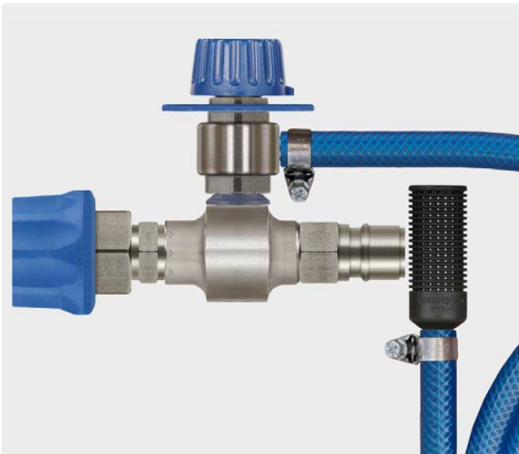
Kupplung ST-45-250 Edelstahl : Stecknippel ST-45-250 Edelstahl. Injektor mit Dosierventil ST-161, Saugschlauch 2.000 mm und Saugfilter ST-31. Max. 250 bar / 90 °C