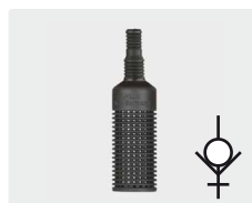
Filter mit Rückschlagventil. Kunststoff. Gewicht Edelstahl