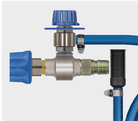
Kupplung ST-45-250 Messing vernickelt : Stecknippel ST-45-250 Stahl verzinkt. Injektor mit Dosierventil ST-161, Saugschlauch 2.000 mm und Saugfilter ST-31. Max. 250 bar / 90 °C