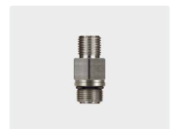
1/4" AG : M14 AG. Rückschlagventil