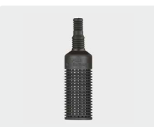
Filter ohne Rückschlagventil. Kunststoff. Gewicht Edelstahl