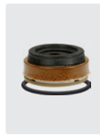
Dichtsatz für 3 Kolben