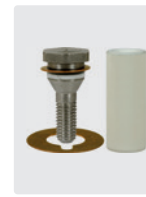
Plungerrohr für 1 Kolben, komplett