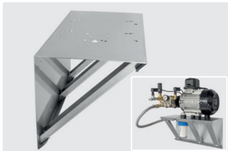
Edelstahl. 270 x 270 x 500 mm. Tragkraft: 80 kg. Passend für unsere Motorpumpenkombinationen mit 3 / 4 / 5,5 und 7,5 KW