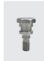
Befestigungsschraube für 1 Kolben