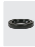
Öldichtungen für 3 Kolben