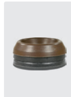
Kolbenringe für 3 Kolben