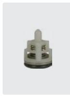
Ventile 6 Stück