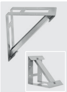
Edelstahl. 200 x 200 x 150 mm. Für AR HPV Motorpumpenkombinationen