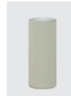
Plungerrohr für 1 Kolben