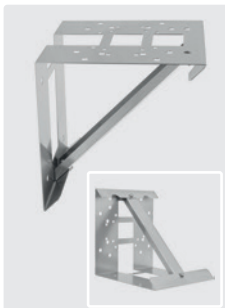
Edelstahl. 280 x 280 x 260 mm. Für Motorpumpenkombinationen 3 / 4 und 5,5 KW