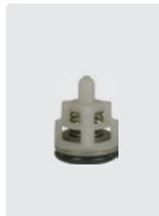
Ventile 6 Stück