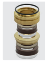
Dichtsatz für 3 Kolben