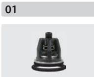
Ventile 6 Stück