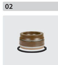
Dichtsätze für 3 Kolben