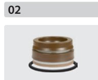
Dichtsätze für 3 Kolben