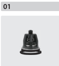
Ventile 6 Stück