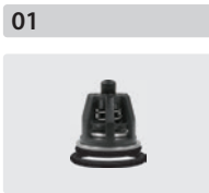
Ventile 6 Stück