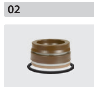
Dichtsätze für 3 Kolben