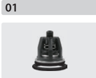
Ventile 6 Stück