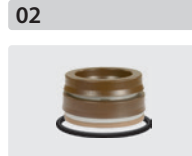
Dichtsätze für 3 Kolben