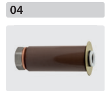
Plungerrohr-Kit für 3 Kolben