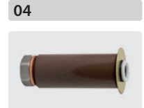
Plungerrohr-Kit für 3 Kolben