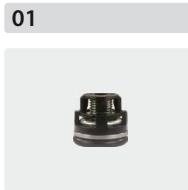
Ventile 6 Stück