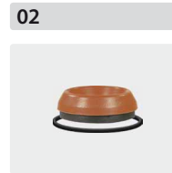
Dichtsätze für 3 Kolben