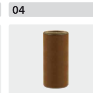
Plungerrohre für 3 Kolben