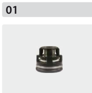
Ventile 6 Stück