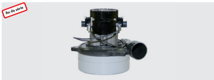
À 2 étages avec tuyère latérale. 24 V. Avec câbles préinstallés