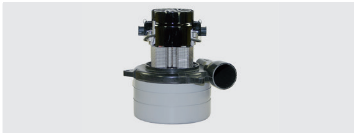
À 3 étages avec tuyère latérale. Avec câbles préinstallés. 262 064 113 : 24 V. 262 074 113 : 36 V