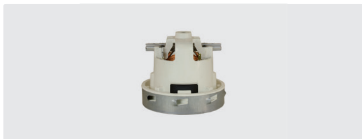
À 1 étage. 230 V / 50 Hz. Sans câble. Câbles de type 1 en option