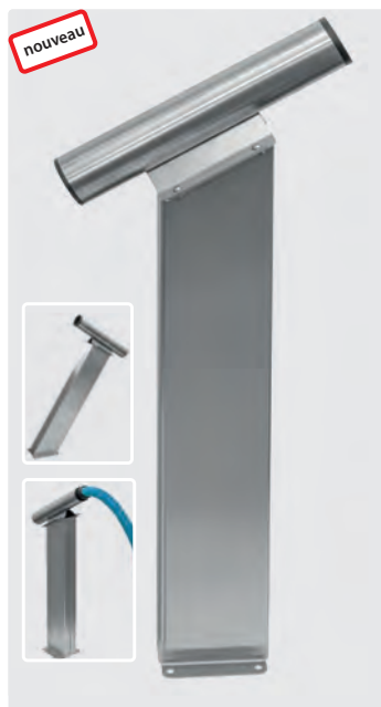
Support obturateur sur console à sceller au sol. Acier inoxydable