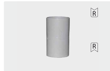
Соед. для шлангов