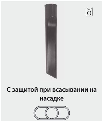
С защитой при всасывании на насадке