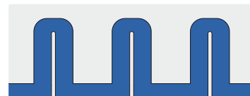
Стандартные всасывающие шланги