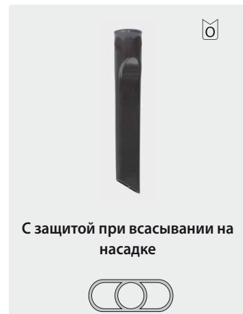
С защитой при всасывании на насадке