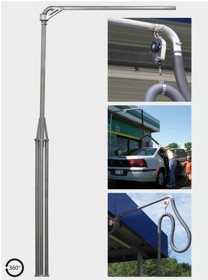
Kreisel mit 360° Bewegungsradius. Höhe 3.100 mm