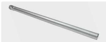
1 Rohrschelle. 1.000 mm