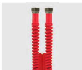
Raccord BSP gaz