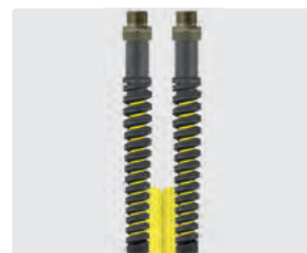
Raccord mâle (AGR)