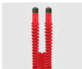
Raccord BSP métrique (DKOL)