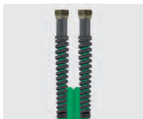
Raccord BSP gaz