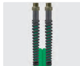
Raccord mâle (AGR)