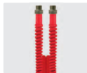
Raccord mâle (AGR)