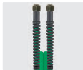
Raccord BSP métrique (DKOL)