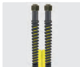
Raccord BSP métrique (DKOL)