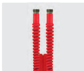
Raccord BSP gaz