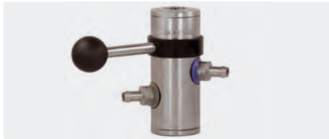
easyfoam365+ Bypass Injektor ST-168 mit Tülle 9 mm und Druckluftmodul (Tülle 9 mm)