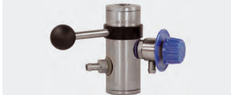
easyfoam365+ Bypass Injektor ST-168 mit Dosier-ventil ST-161 und Druckluftmodul (Tülle 9 mm)