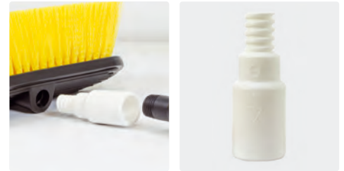
Adapter für Lanzen ohne Kordelgewinde. Kordelgewinde AG : Gewinde IG konisch