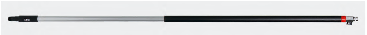
Alustiel. Ergonomischer Stiel mit isoliertem Griff und Kugelhahn. Stecknippel passend für Nito System