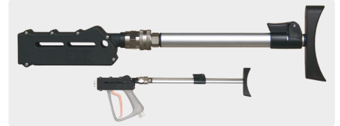
ST-3900 Schulterstützen. Neue EU-Richtlinien schreiben den Gebrauch von Schulterstützen bei Arbeiten mit einer Rückstoßkraft von mehr als 150 N zwingend vor. Stufenlos verstellbare Schulterstütze. Drehbare Kupplung. Geeignet für alle Pistolen ST-3600 / ST-3500.