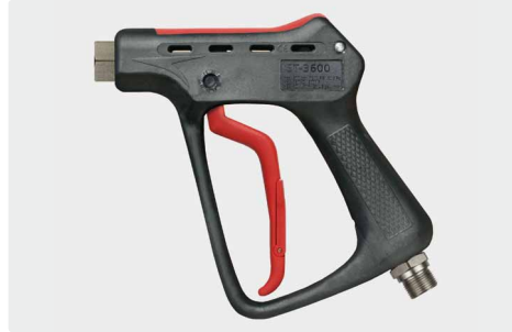
Professionelle Höchstdruckpistole. Max. 500 bar / 80 l/min / 150 °C