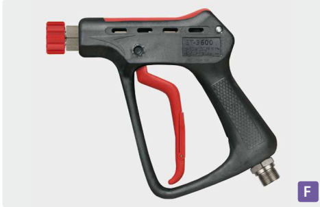
Professionelle Höchstdruckpistole mit HV M22. Max. 500 bar / 80 l/min / 150 °C