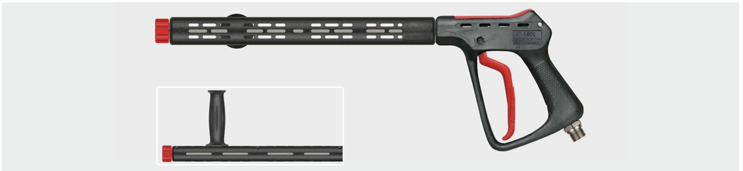
Professionelle Höchstdruckpistole mit Verlängerung ST-9 380 mm, Handgriff und HV M22. Max. 500 bar / 80 l/min / 150 °C