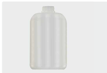
Ersatzflasche 2 Liter