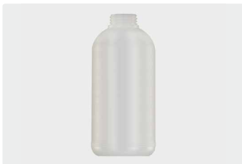
Ersatzflasche 1 Liter