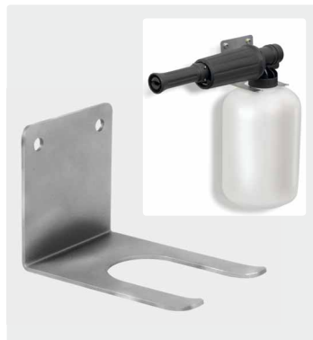
Wandhalter. Edelstahl. 68 mm x 95 mm.