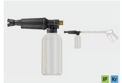
M22 AG. Пеноинжектор с дозировкой и бутылкой. Макс. 300 bar / 80 °C