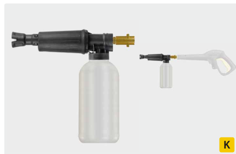
Bajonett K. Messing. Schauminjektorlanze mit Dosierung und Flasche. Max. 300 bar / 80 °C