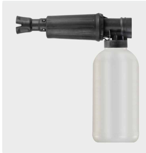
1/4" IG. Schauminjektorlanze mit Dosierung und Flasche. Max. 300 bar / 80 °C