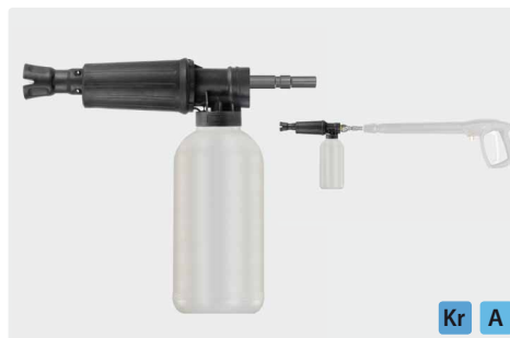
Stecknippel KW. Schauminjektorlanze mit Dosierung und Flasche. Max. 300 bar / 80 °C