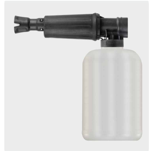
1/4" IG. Schauminjektorlanze mit Dosierung und Flasche. Max. 300 bar / 80 °C