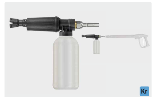
Stecknippel KR. Schauminjektorlanze mit Dosierung und Flasche. Max. 300 bar / 80 °C