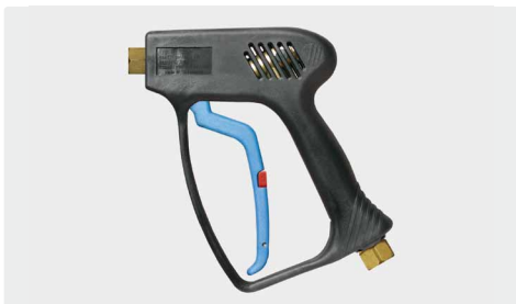
ST-1500 с защ. от зам.

Профес. пистолет. Исполнение с защитой от замерзания. Макс. 275 bar / 45 л/мин / 150 °C