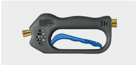
ST-601 линейный с защ. от зам.

Исполнение с защитой от замерзания. Макс. 275 bar / 45 л/мин / 150 °C