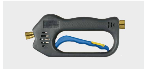
ST-601 линейный Weep

Weep-исполнение. Макс. 275 bar / 45 л/мин / 150 °C