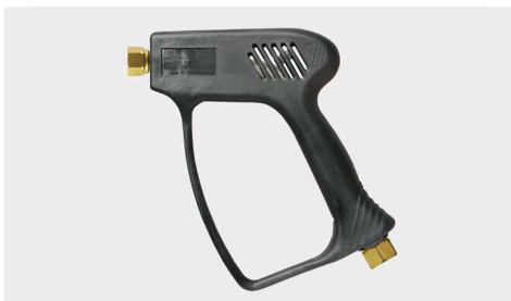
ST-1500 без вентиля (свободный поток)

Профес. пистолет без вентиля (свободный поток). Макс. 275 bar / 45 л/мин / 150 °C