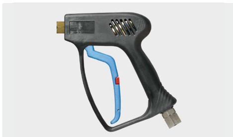
ST-1500 с защ. от зам.

Профес. пистолет. Исполнение с защитой от замерзания. Макс. 275 bar / 45 л/мин / 150 °C