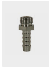
Edelstahl. Max. 150 °C