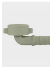
Kunststoff. Max. 60 °C