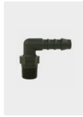
Kunststoff. Max. 60 °C