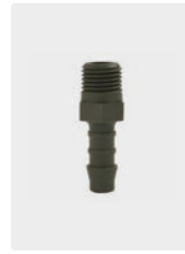
Kunststoff. Max. 60 °C