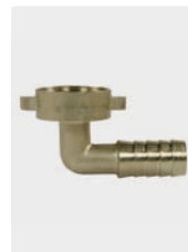
Messing. Max. 150 °C