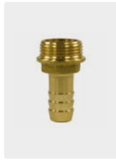
Messing. Max. 150 °C