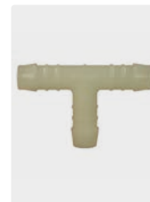
Kunststoff. Max. 60 °C