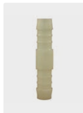
Kunststoff. Max. 60 °C