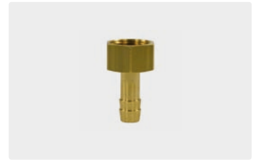
Messing. Max. 150 °C