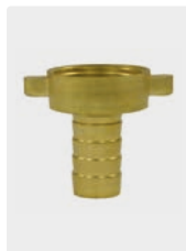
Messing. Max. 150 °C