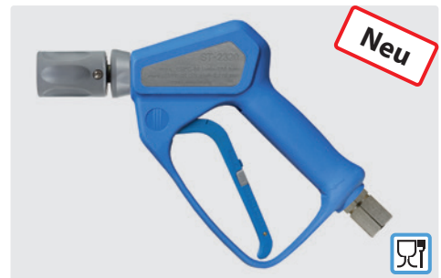
ST-2320 mit Schwalldüse ST-51.1