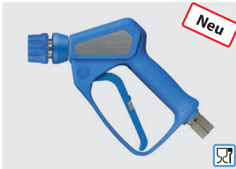
ST-2320 mit Kupplung ST-3100