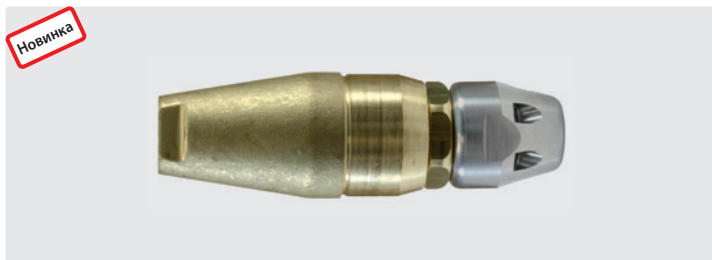
ST-357.1. Max. 250 bar / 100 °C

места, где направленная вперед точечная струя конусной формы с достаточной силой проходит через корни или отложения фрезерованием. Также идеально подходит для размельчения целлюлозы или жиросодержащих отложений.