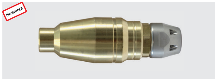
ST-458.1. Max. 400 bar / 100 °C