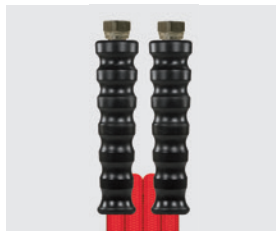
Raccord BSP gaz