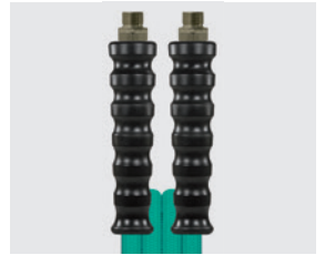
Raccord mâle (AGR)