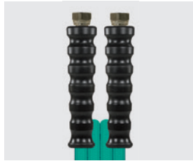
Raccord BSP gaz