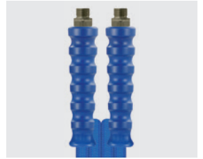
Raccord mâle (AGR)