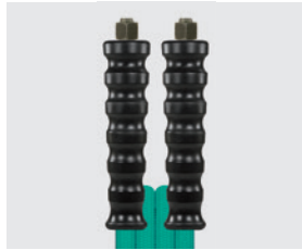
Raccord BSP métrique (DKOL)