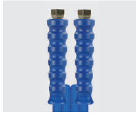
Raccord BSP gaz