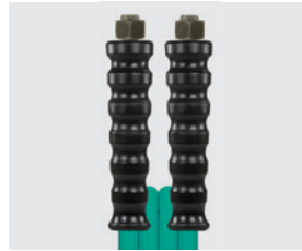
Raccord BSP métrique (DKOL)