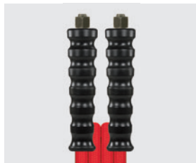
Raccord BSP métrique (DKOL)