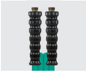
Raccord BSP gaz