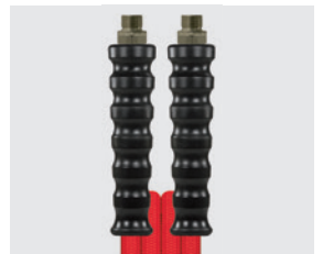
Raccord mâle (AGR)