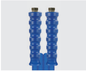
Raccord BSP gaz