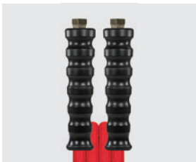
Raccord BSP gaz