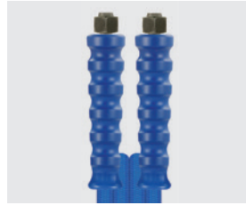
Raccord BSP métrique (DKOL)