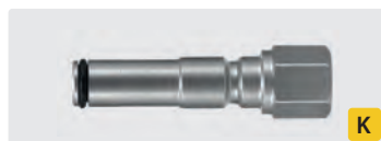
ST-247 : 1/4" F. Acier inox trempé. Max. 400 bar / 150° C