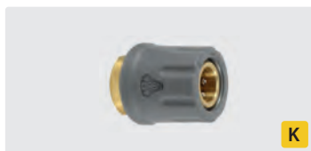
TR22 F. Laiton. Max. 400 bar / 150° C