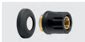
M22 F. Laiton. Incl. 1 garniture de protection. Max. 400 bar / 150° C