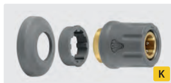
TR22 F. Laiton. Incl. 2 garnitures de protection. Max. 400 bar / 150° C