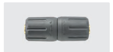
ST-247. Laiton. Max. 310 bar / 45 l/min / 150° C