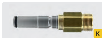
ST-247 : M22 M. Acier inox trempé. Max. 400 bar / 150° C