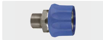
Kupplung : AG. Edelstahl. 60° Dicht- konus. Max. 250 bar / 150 °C