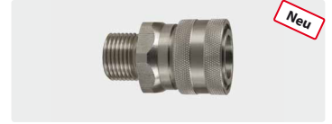
Kupplung : AG. Edelstahl. 60° Dicht- konus. Max. 250 bar / 150 °C