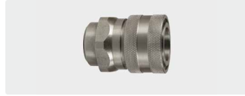
Kupplung : IG. Edelstahl. Max. 250 bar / 150 °C