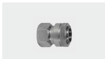
Kupplung : IG. Edelstahl. Max. 150 bar / 90 °C