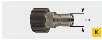
Stecknippel : IG. Edelstahl + Messing. Max. 250 bar / 150 °C