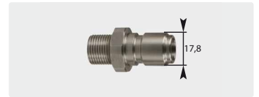
Stecknippel : AG. Edelstahl. 60° Dicht- konus. Max. 250 bar / 150 °C