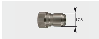
Stecknippel : IG. Edelstahl. Max. 250 bar / 150 °C