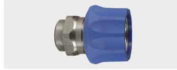
Kupplung : IG. Edelstahl. Max. 250 bar / 150 °C