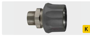
Kupplung : AG. Edelstahl. Max. 250 bar / 150 °C