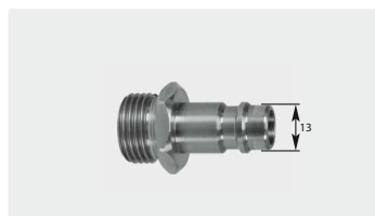
Stecknippel : AG. Edelstahl. Max. 150 bar / 90 °C