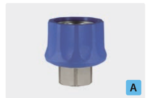
Kupplung : IG. Messing vernickelt. Max. 250 bar / 150 °C