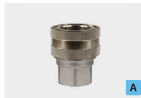
Kupplung : IG. Messing vernickelt. Max. 250 bar / 150 °C