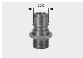
Stecknippel : AG. Edelstahl ungehärtet. Max. 250 bar / 150 °C