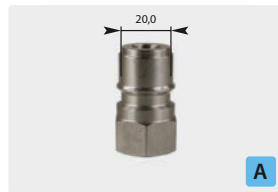
Stecknippel : IG. Edelstahl. Max. 250 bar / 150 °C