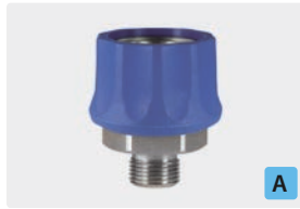
Kupplung : AG. Edelstahl. Max. 250 bar / 150 °C