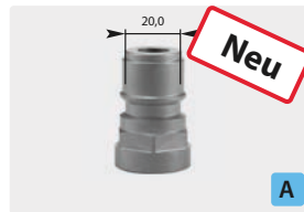
Stecknippel : IG. Edelstahl gehärtet. Max. 250 bar / 150 °C