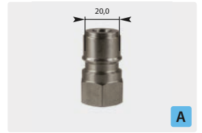
Stecknippel : IG. Edelstahl gehärtet. Max. 250 bar / 150 °C