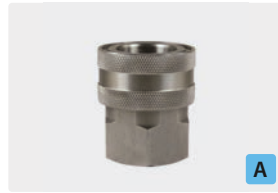
Kupplung : IG. Edelstahl. Max. 250 bar / 150 °C