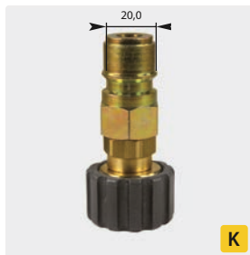
Stecknippel : IG. Stahl verzinkt + Messing. Max. 250 bar / 150 °C