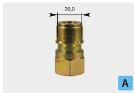
Stecknippel : IG. Stahl verzinkt. Max. 250 bar / 150 °C