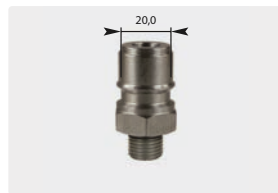
Stecknippel : AG. Edelstahl gehärtet. Max. 250 bar / 150 °C