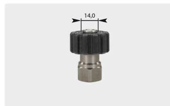
M22 : IG. Edelstahl. Max. 500 bar