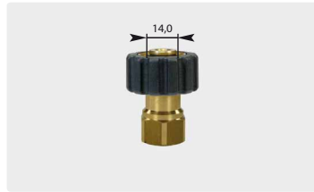
Standard M22 : IG. Schwarz. Max. 400 bar / 150 °C