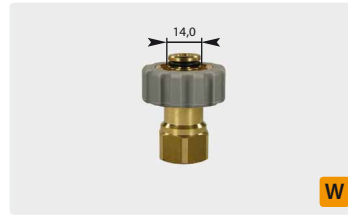
Standard M21: IG. Grau. Max. 400 bar / 150 °C