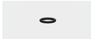
O-Ring. 10x2. Perbunan