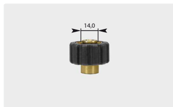
Kurz M22 : IG. Schwarz. Max. 400 bar / 150 °C