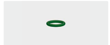
O-Ring. 10x2. Viton