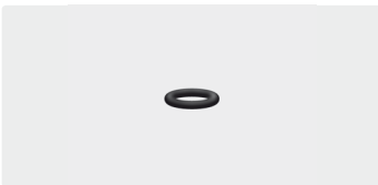
O-Ring. 10x2,2. Perbunan