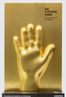
Präventionspreis der BGHW