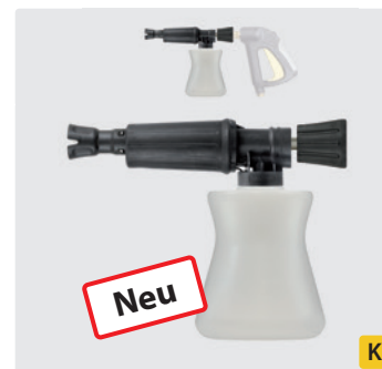
HV M22 drehbar. Schauminjektorlanze mit Dosierung und Flasche. Max. 300 bar / 80 °C