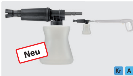
Stecknippel KW. Schauminjektorlanze mit Dosierung und Flasche. Max. 300 bar / 80 °C