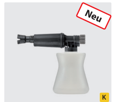
TR20 IG. Edelstahl. Schauminjektorlanze mit Dosierung und Flasche. Max. 300 bar / 80 °C