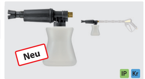
M22 AG. Schauminjektorlanze mit Dosierung und Flasche. Max. 300 bar / 80 °C