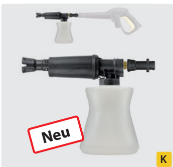
Bajonett K. Kunststoff. Schauminjektorlanze mit Dosierung und Flasche. Max. 180 bar / 80 °C