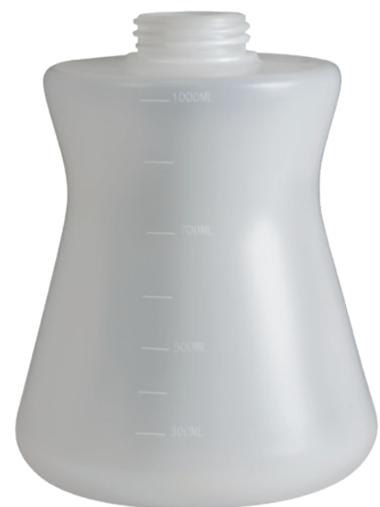
Neue 1-Liter-Flasche mit Skala: Füllstand ablesbar.