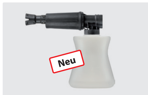
1/4" IG. Schauminjektorlanze mit Dosierung und Flasche. Max. 300 bar / 80 °C