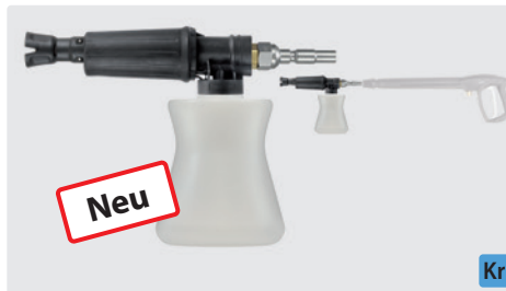
Stecknippel KR. Schauminjektorlanze mit Dosierung und Flasche. Max. 300 bar / 80 °C