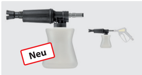
ST-247. Schauminjektorlanze mit Dosierung und Flasche. Max. 300 bar / 80 °C