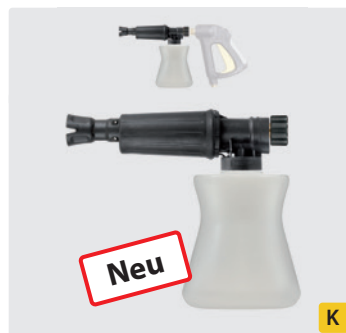
HV M22. Schauminjektorlanze mit Dosierung und Flasche. Max. 300 bar / 80 °C