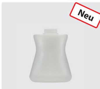
Ersatzflasche 1 Liter für ST-73.1 und ST-73.2