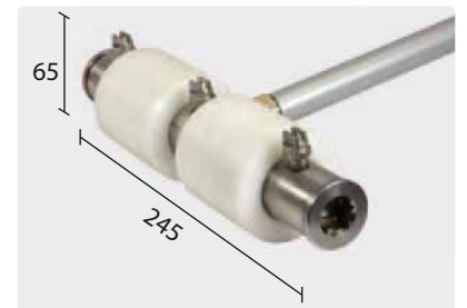
Spitze: Leichtgängig durch POM-Kunststoffrollen, Durchmesser: 60 mm.

Optimal erreichbar: Ganz ohne Hebebühne. Vom Boden her sauber!