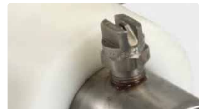
Auf Achse: Flachstrahldüsen für Ihre Anforderungen einsetzbar.