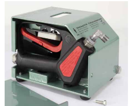
Возможные исполнения: встроенные пистолеты ST-2605 с 350 bar или ST-2750 с 500 bar