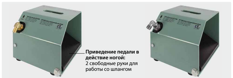
Приведение педали в действие ногами: 2 свободные руки для работы со шлангом

Включая пистолет ВД ST-2605 с угловым переходником из латуни на выходе. Корпус из крашенной стали. Резиновые ножки. Max. 350 bar / 45 л/мин / 150 °C