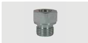
Sechskant. Stahl verzinkt