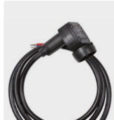
Repair-Kit Schalter ST-7. Kabel 1.200 mm