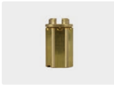
Schwimmer ST-5 / ST-505 ohne Bohrung