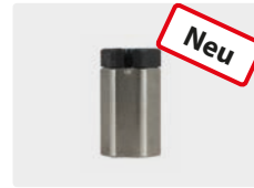
Schwimmer ST-505 ohne Bohrung