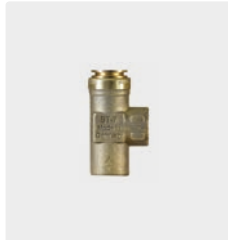
Repair-Kit Schwimmer ST-7