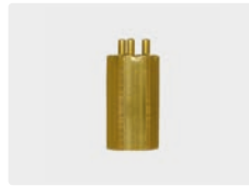
Schwimmer ST-5 (200 005 601) mit Bohrung