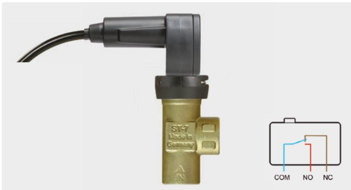
3/8" IG. Schutzklasse IP65. Kabel 1.200 mm. 10 A. 250 V. Einschaltstrom 20 A (Öffner) und 15 A (Schließer). Max. 350 bar / 45 l/min / 80 °C