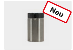
Schwimmer ST-505 mit Bohrung