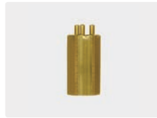
Schwimmer ST-5 (200 005 601) mit Bohrung