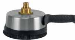
Wandreiniger, Seite 256+295