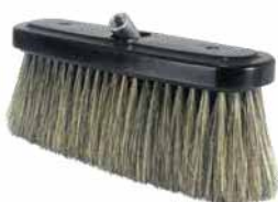
Flächenwäscher, Seite 32+285