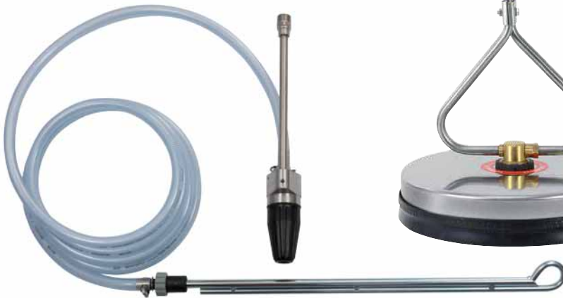
Wassergranulatstrahler ST-555, Seite 289