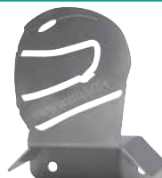
Motorradhelmhalterung, Seite 400