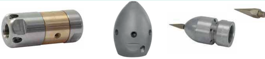
Rohreinigungsdüsen, Seite 181, 182+185