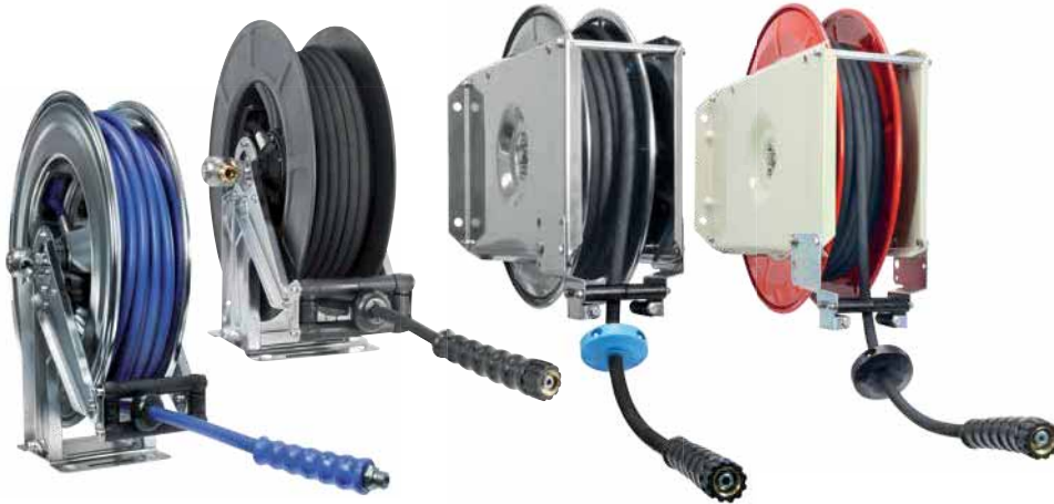
Automatik Schlauchaufroller fertig konfektioniert, Seite 378+379