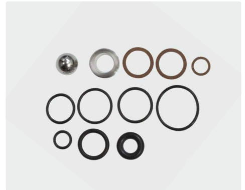
Rep. Kit VB85