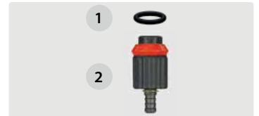
Dosierung, Tülle 6 mm