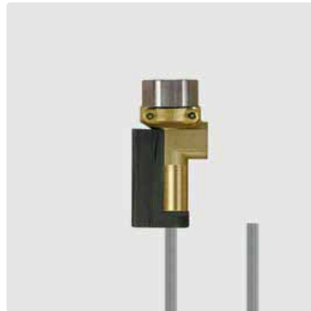
Druckschalter (IP55) mit Kabel 1.200 mm.