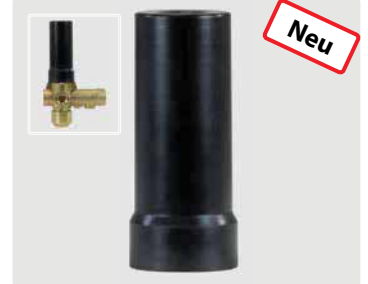
Ventilsperre für ST-261. Nicht für Paneleinbau geeignet.