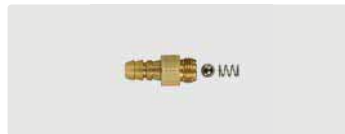
Chemie-Rückschlagventil. Tülle 6 mm