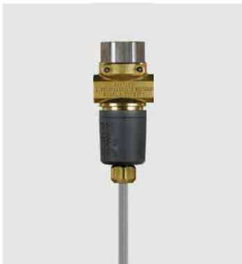
Druckschalter (IP65) 3-adrig mit Kabel 1.200 mm