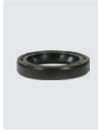
Öldichtungen für 3 Kolben