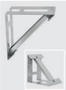
Edelstahl. 200 x 200 x 150 mm. Für AR HPV Motorpumpenkombinationen