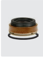
Dichtsatz für 3 Kolben