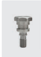
Befestigungsschraube für 1 Kolben