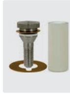
Plungerrohr für 1 Kolben, komplett