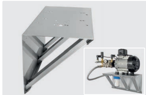
Edelstahl. 270 x 270 x 500 mm. Tragkraft: 80 kg. Passend für unsere Motorpumpenkombinationen mit 3 / 4 / 5,5 und 7,5 KW