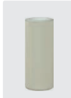
Plungerrohr für 1 Kolben