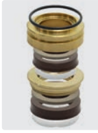
Dichtsatz für 3 Kolben