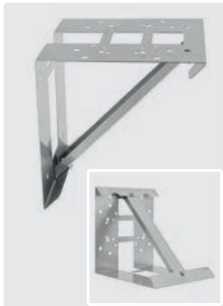
Edelstahl. 280 x 280 x 260 mm. Für Motorpumpenkombinationen 3 / 4 und 5,5 KW