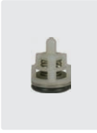
Ventile 6 Stück