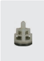
Ventile 6 Stück