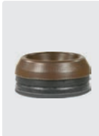
Kolbenringe für 3 Kolben