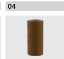
Plungerrohre für 3 Kolben