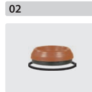
Dichtsätze für 3 Kolben