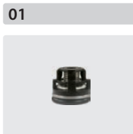
Ventile 6 Stück