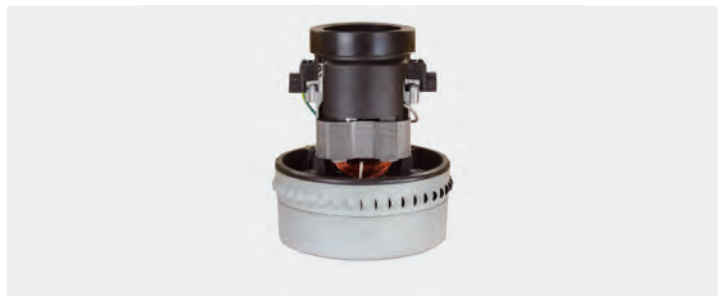
À 2 étages. 230 V / 50 Hz. Avec câbles préinstallés