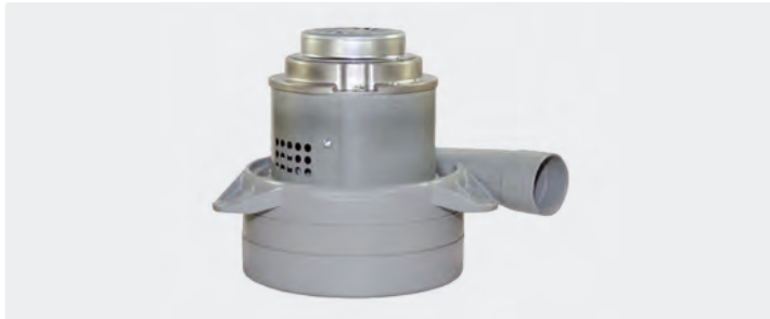
À 3 étages avec tuyère latérale. 230 V / 50 Hz. Avec câbles préinstallés