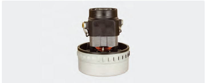
À 2 étages. 230 V / 50 Hz. Avec câbles préinstallés