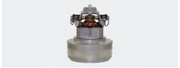
À 2 étages. 230 V / 50 Hz. Avec câbles préinstallés