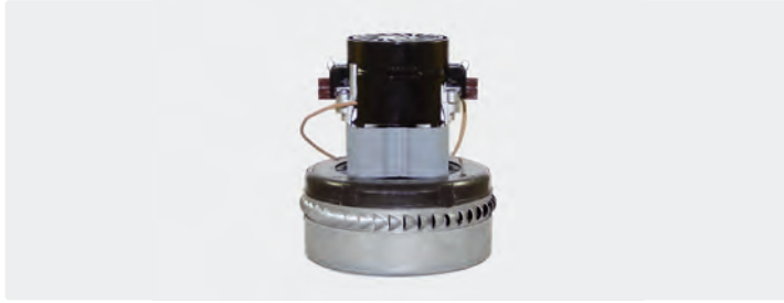
À 2 étages. 230 V / 50 Hz. Avec câbles préinstallés