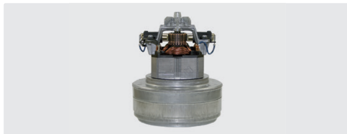
À 2 étages. 230 V / 50 Hz. Avec câbles préinstallés