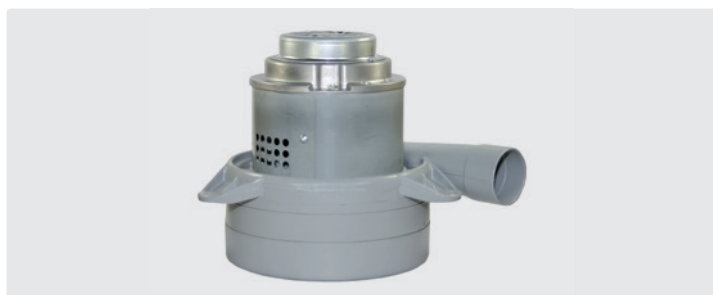
À 3 étages avec tuyère latérale. 230 V / 50 Hz. Avec câbles préinstallés