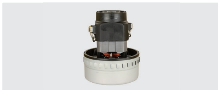
À 2 étages. 230 V / 50 Hz. Avec câbles préinstallés