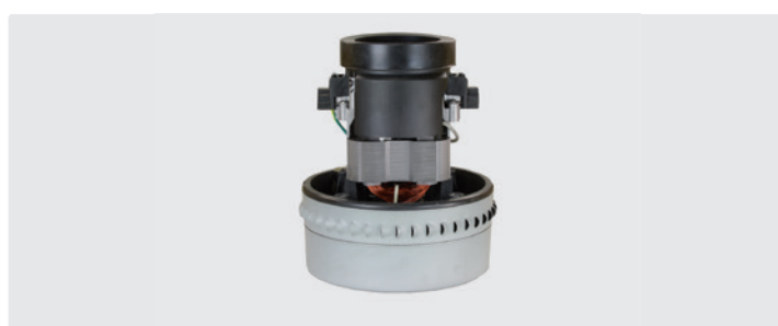
À 2 étages. 230 V / 50 Hz. Avec câbles préinstallés