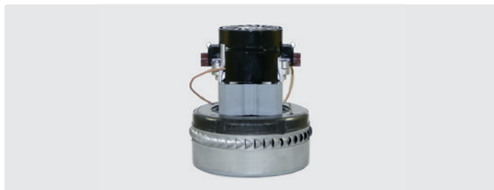
À 2 étages. 230 V / 50 Hz. Avec câbles préinstallés