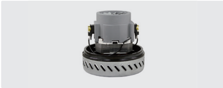
1-stufig. 230 V / 50 Hz. Kabeltyp 2 beigelegt