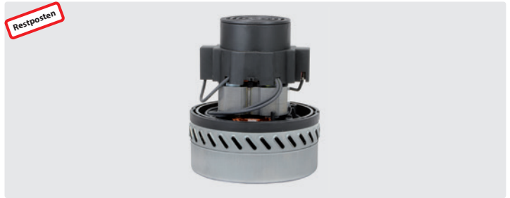
2-stufig. 24 V. Kabel vorinstalliert