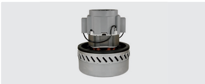
2-stufig. 230 V / 50 Hz. Kabeltyp 2 beigelegt