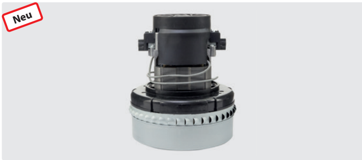
2-stufig. 230 V / 50 Hz. Kabeltyp 1 beigelegt