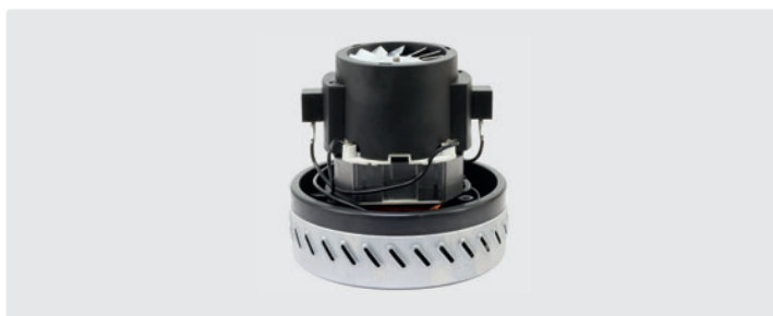
1-stufig, 230 V / 50 Hz. Kabel vorinstalliert