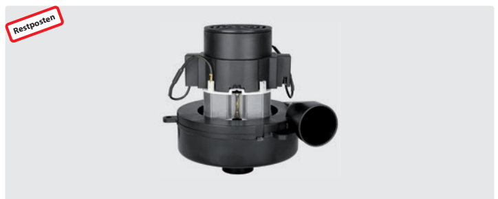
1-stufig mit Abluftrohr und Stutzen. 230 V / 50 Hz. Kabeltyp 3 beigelegt