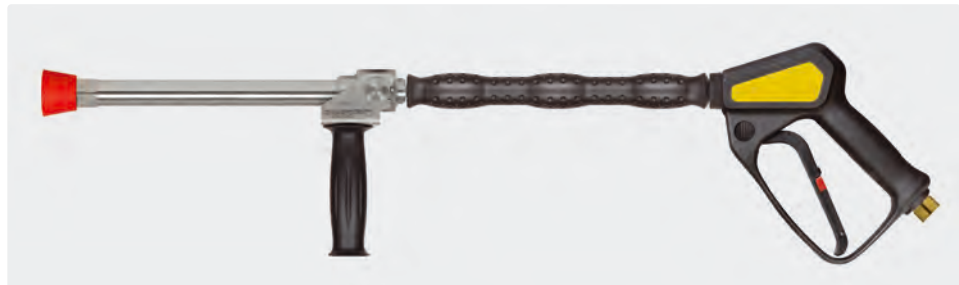
Lance d'hydro-balayage 350 mm acier inoxydable avec manchon ST-29 Cool & Compact 330 mm, pistolet ST-2300, poignée latérale et protège-buse en PVC, livrée sans buse. Max. 280 bar / 45 l/min / 100 °C