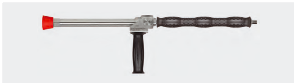
Lance d'hydro-balayage 350 mm acier inoxydable avec manchon ST-29 Cool & Compact 330 mm, poignée latérale et protège-buse en PVC, livrée sans buse. Max. 280 bar / 130 l/min / 100 °C