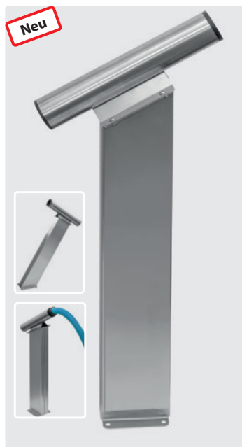
Fugendüsenaufnahme auf Säule für Bodenbefestigung. Edelstahl