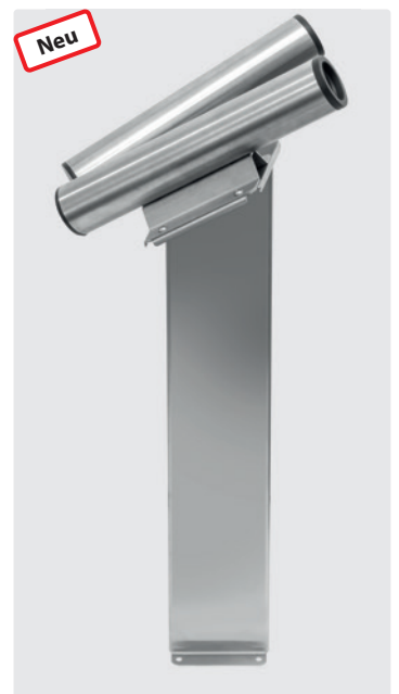
Zweifach-Fugendüsenaufnahme auf Säule, inkl. Adapterplatte. Edelstahl