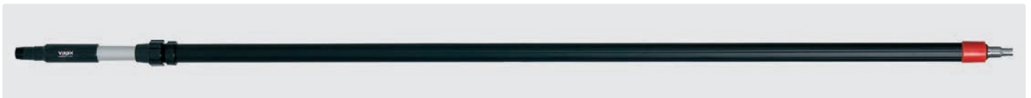
Alustiel. Teleskopstiel mit isoliertem Griff. Schlauchtülle passend für 1/2" und 3/4" Schlauch