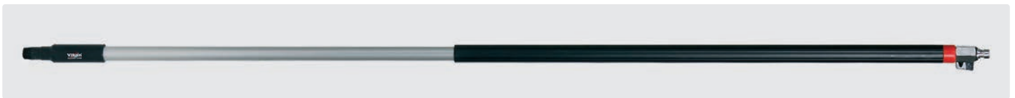
Alustiel. Ergonomischer Stiel mit isoliertem Griff und Kugelhahn. Stecknippel passend für Nito System