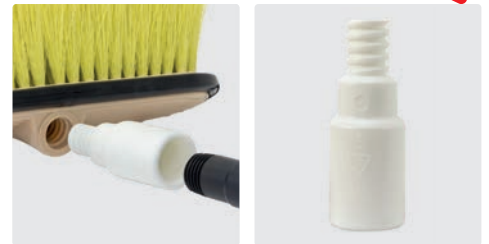
Adapter für Lanzen ohne Kordelgewinde. Kordelgewinde AG : Gewinde IG