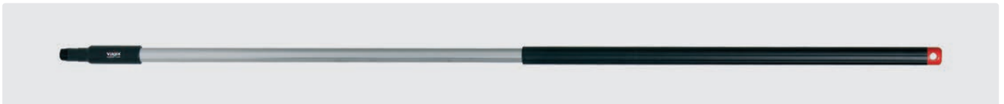
Alustiel. Ergonomischer Stiel mit isoliertem Griff