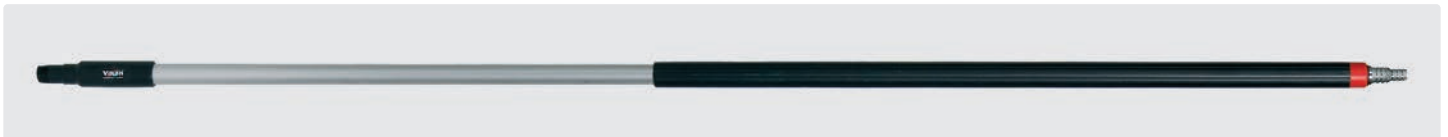
Alustiel. Ergonomischer Stiel mit isoliertem Griff. Schlauchtülle passend für 1/2" und 3/4" Schlauch