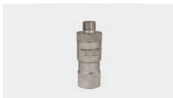
1/4" M BSP - 3/8" F NPT