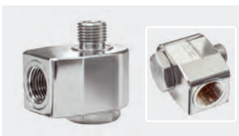
1/4" M BSP - 3/8" F NPT