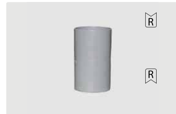
Соед. для шлангов