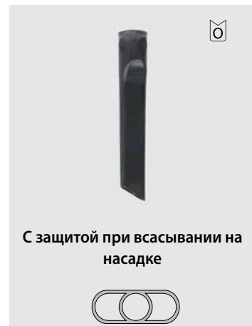
С защитой при всасывании на насадке