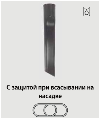
С защитой при всасывании на насадке