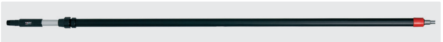
Alustiel. Teleskopstiel mit isoliertem Griff. Schlauchtülle passend für 1/2" und 3/4" Schlauch