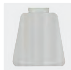
Réservoir de rechange 1 litre