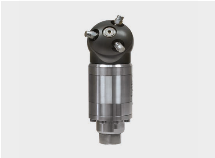
ST-82 h16/40 Selbstdrehender Tankreiniger