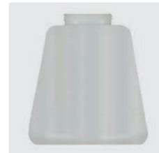
Flasche 1 l