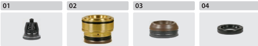
Ventile 6 Stück