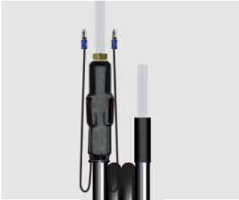
Für neue Lanze.