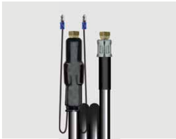
Für alte Lanze.